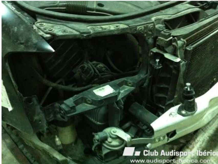
Diferentes vistas de los soportes realizados para los faros de forma artesanal.

4. Para encajar los faros en el frontal de b7, es necesario cambiar todo el frontal o bien optar por hacer unos soportes de forma manual. Yo recomiendo esta última opción, ya que los soportes van por dentro del paragolpes y el faro de b7 solo lleva un tornillo a la vista en la parte superior, que se puede sujetar tal cual y queda bastante de origen. Cambiar todo el frontal sería un lío, y luego los ventiladores podrían no encajar según nuestro motor (1.9 1.8 2.0) y el frontal que montemos.