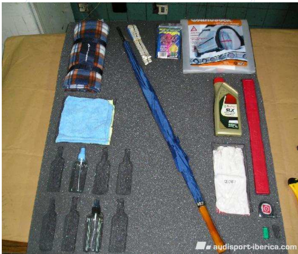
8- Otra más sobre fondo claro para ver el efecto.