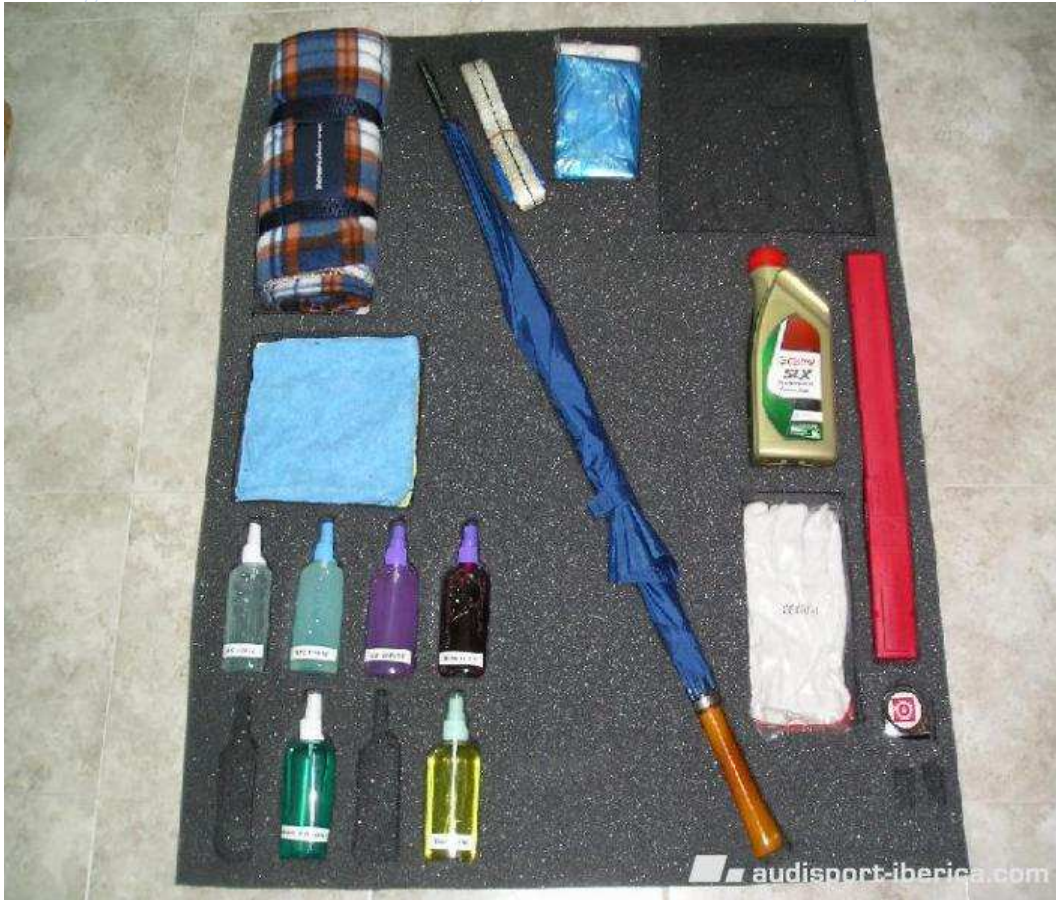
9- Colocado en el doble fondo.